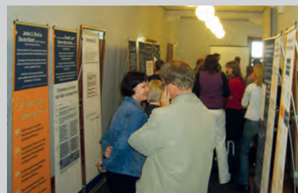
Ausstellungseröffnung in der Landtagsfraktion der SPD 18.09.2007